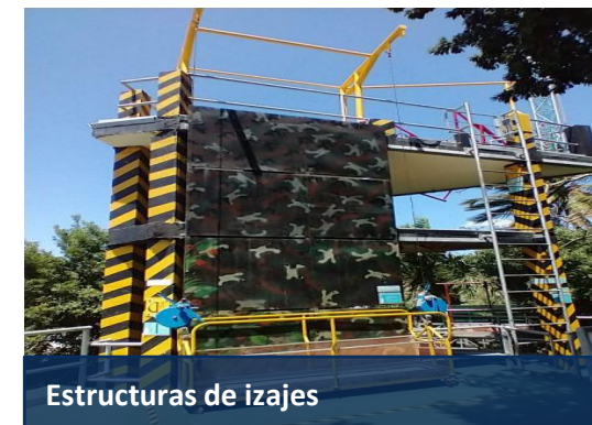
Estructuras de izajes