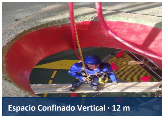
Espacio Confinado Vertical · 12 m