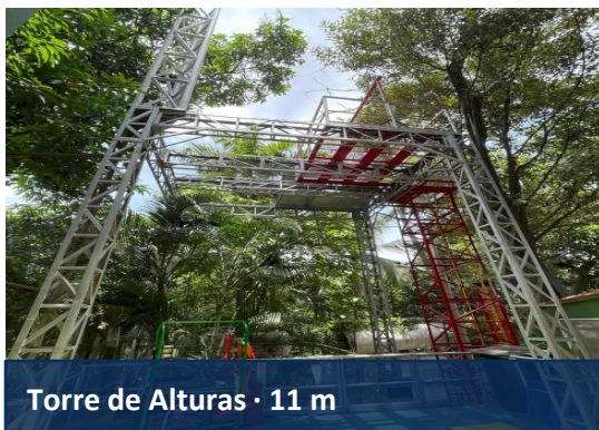
Torre de Alturas · 11 m