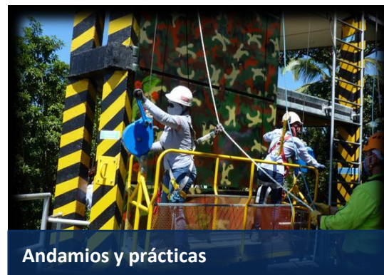
Andamios y prácticas